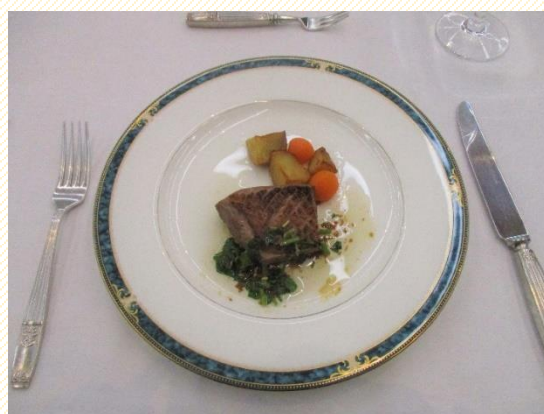
鴨のコンフィ 山椒のソース (肉料理)