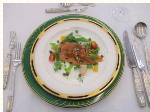
帆立貝とサーモンのマリネ 柑橘系のサラダ仕立て (前菜)