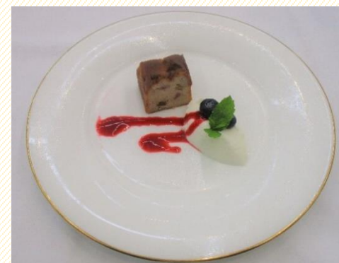
フルーツの入った ヴィジタンディーヌ (デザート)